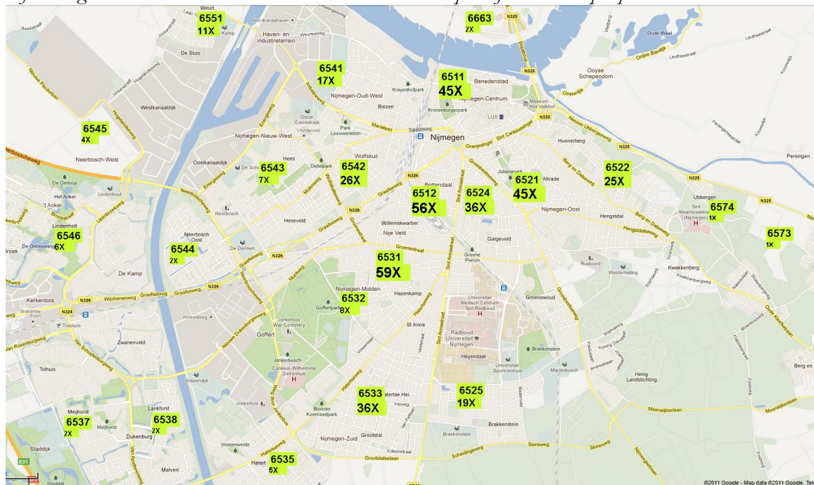
Afbeelding 1: aantal huurders dat in 2009 en 2010 aanklopte bij huurteams per postcode

Bovenstaand overzicht laat zien dat de zaken geconcentreerd zijn in de verwachte gebieden in het centrum en zuiden van Nijmegen. Acht zaken buiten Nijmegen en acht zaken waarvan de postcode niet bekend is, zijn niet in het overzicht opgenomen.